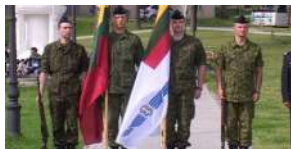
Lietuvos karo aviacijos bazė švenčia gimtadienį

Aktualijos Verslas Nusikaltimai ir nelaimės Kultūra Sportas Piliētis-reporteris