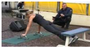
Gimtadienius švenčia ir Šiaulių kultūristai