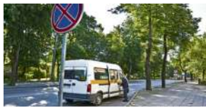
„Mikriukams“ dar kartą priminė, kad sutarčių nepratęs