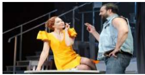
Šiaulių dramos teatre rieda „Geismų tramvajus“